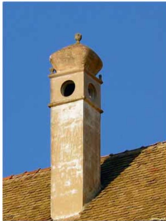
A "Török-ház" kéménye, Alsóörs

Alsóörsön a mai napig áll a török adószedő háza, melynek magas kéményét turbánra emlékeztető gombos dísz koronáz.