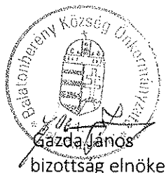
Gazda János bizottság elnöke

Miután más napirend és hozzászólás nem volt a bizottság elnöke a nyilvános rendkívüli ülést 14 óra 35 perckor bezárja.