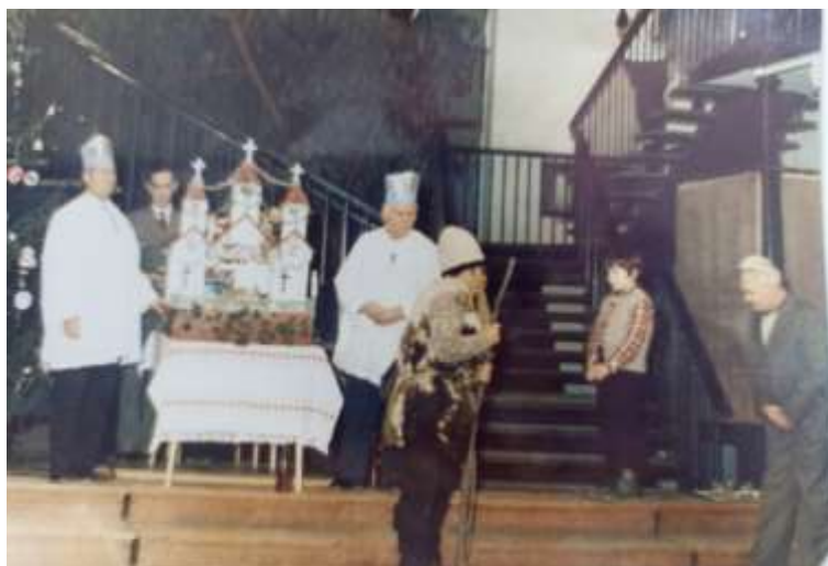
A kép készült: 1986. december 16., Kaposváron

Esik a hó, fúj a szél, A jégcsapok muzsikálnak, A hópelyhek táncot járnak. Valaminek örülnek tán? Hát megszületett a Kis Jézus! Az angyalok énekelnek, A pásztorok útra kelnek. Családokban boldogság van, Karácsonyfát körbe álljuk, Köszöntjük a Szentcsaládot. Örülünk az ajándéknak. Kandallóban tűz ropog, Érezzük az ünnep melegét. Letérdelve imádkozunk. Egészséget, egy békés, boldog, szép jövőt Hozzál nekünk Kis Jézusunk! Áldott, Békés Karácsonyt a földön minden embernek!