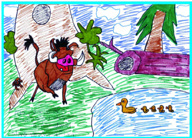
Svéninger Dóra: Pumba és az erd